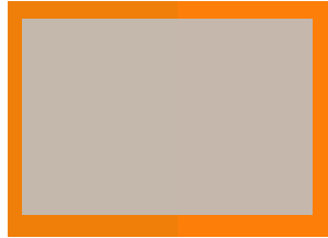
2/1 im Satzspiegel – über Bund laufend 388 mm breit x 252 mm hoch