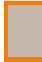
1/1 im Satzspiegel 181 mm breit x 270 mm hoch