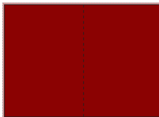
2/1 mit Anschnitt – über Bund laufend 420 mm breit x 297 mm hoch plus 3 mm Beschnitt