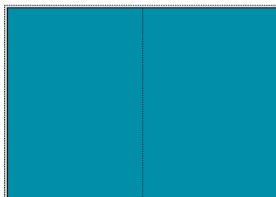
2/1 mit Anschnitt – über Bund laufend 420 mm breit x 297 mm hoch (plus 3 mm Beschnitt)